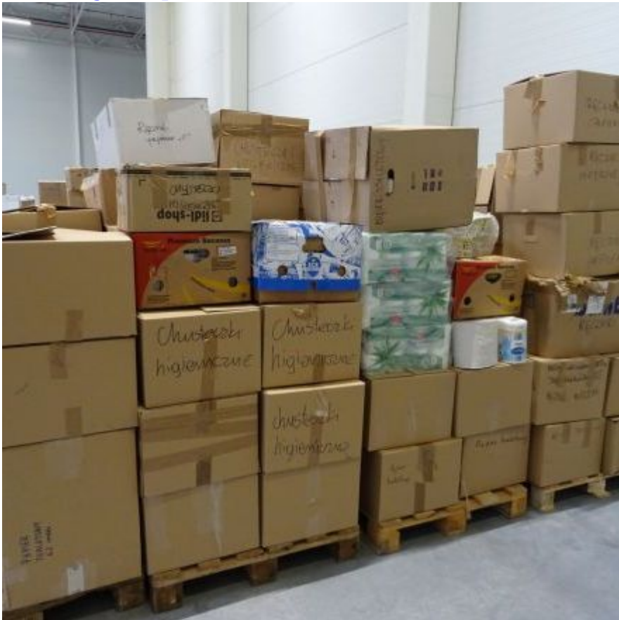
Zaangażowanie Katowickich Wodociągów w pomoc Ukrainie (7)