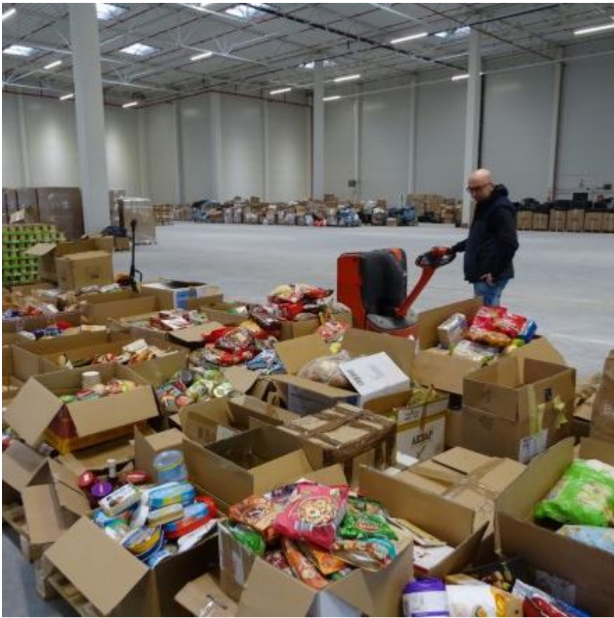
Wodociągów w pomoc Ukrainie (6)