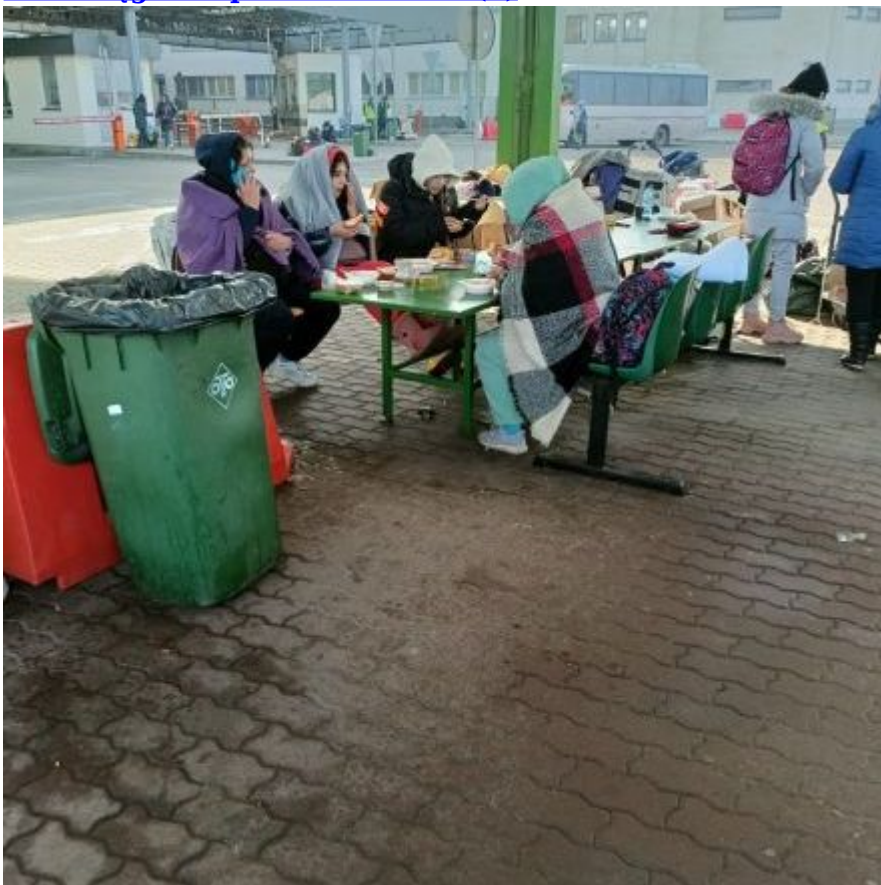
Wodociągów w pomoc Ukrainie (5)