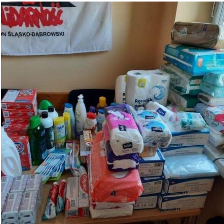
Wodociągów w pomoc Ukrainie (12)