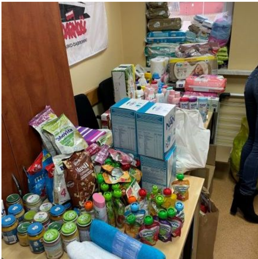
Wodociągów w w pomoc Ukrainie