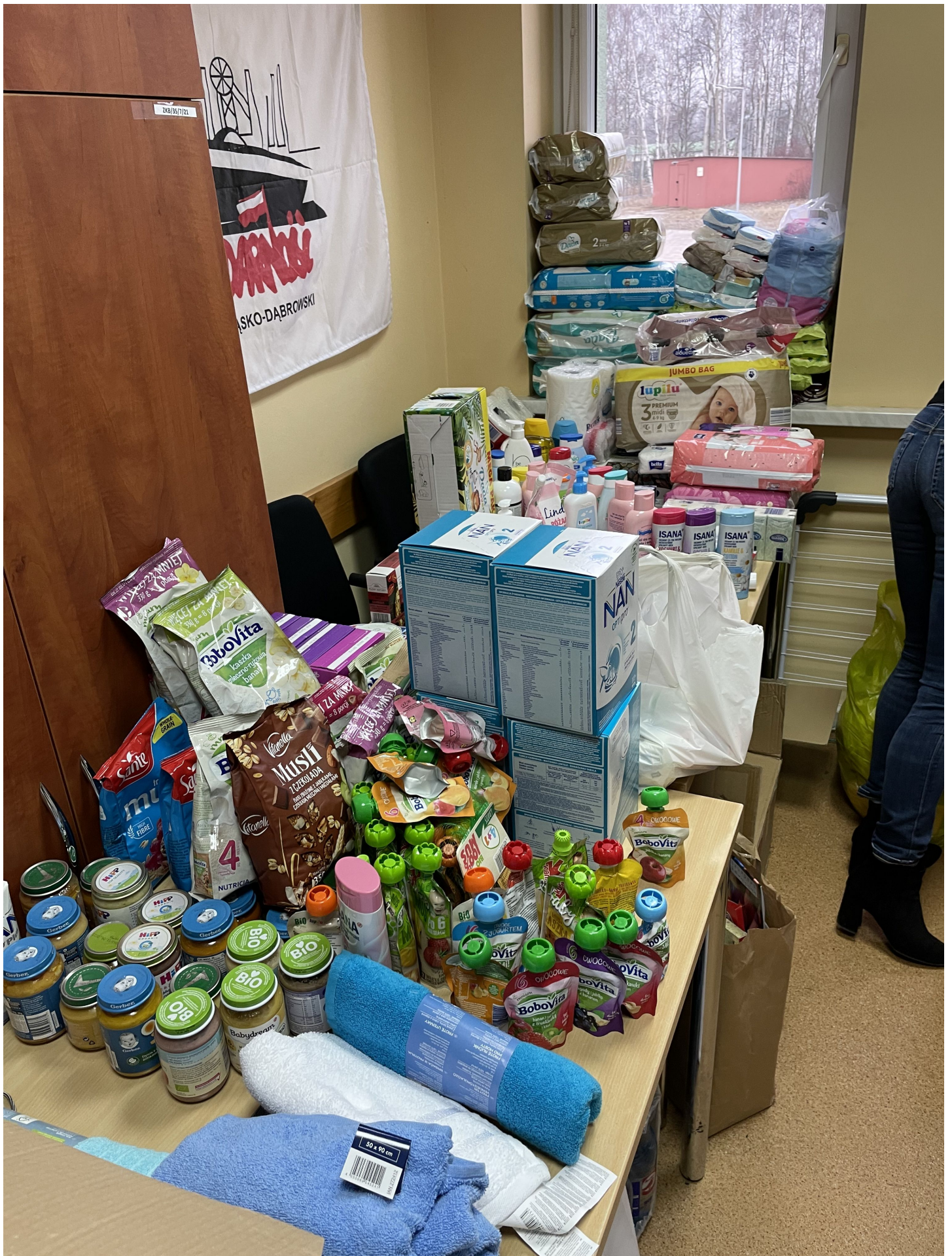
Zaangażowanie Katowickich Wodociągów w pomoc Ukrainie (1)