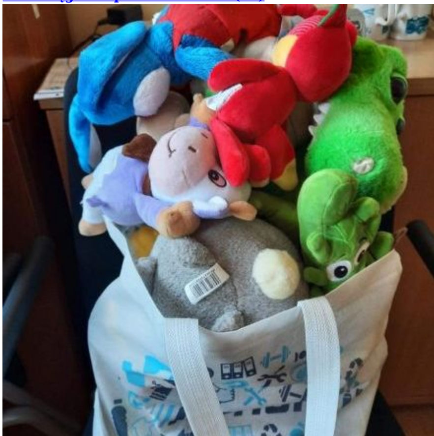
Wodociągów w pomoc Ukrainie (11)