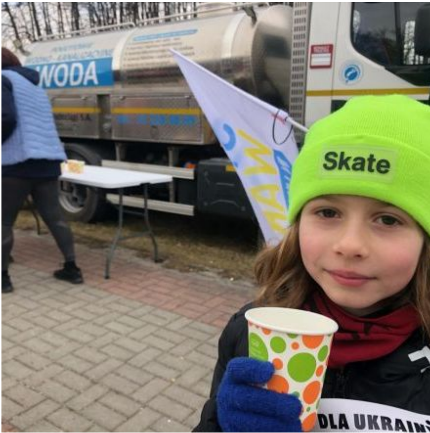
Zaangażowanie Katowickich Wodociągów w pomoc Ukrainie (8)